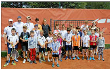
Fröhliche Kinder und engagierte Trainer

Die Fördergemeinschaft und der Ski-Club möchten sich herzlich bei den Trainern, den Organisatoren und allen Beteiligten bedanken, die zum Gelingen dieses tollen Tenniscamps beigetragen haben.