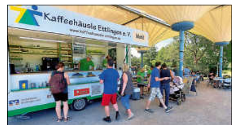
Unser Kaffeemobil im Horbachpark

Mit der Verköstigung von Kaffee und Kuchen anlässlich des Musikschul-fests am 23.07. verabschieden wir uns in die Sommerpause. Weiter geht es am 3.9. wie gewohnt im Horbachpark von 14 bis 18 Uhr an unserem bekannten Stamplatz beim Pavillon. Am 9.9. ab 11 Uhr findet das Wasenparkfest statt. Wir sind dabei und Sie können sich bei uns gerne verköstigen lassen. Das Fest ist ein Gemeinschaftsprojekt des Jugendgemeinderates, des Seniorenbeirates und der Stadt. Fußball und Boule stehen im Mittelpunkt der Veranstaltung. Gleich am 10.9. sind wir wieder im Horbachpark aktiv und am 17.09. von 13 Uhr bis 18 Uhr findet bereits zum neunten Mal das Kinderfest der Stadt im Horbachpark statt. Neben vielen anderen Vereinen und Organisationen beteiligen wir uns auch an dem Programm.