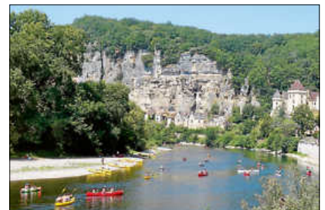
An der Dordogne

von Doris Krah. Radreise von Ettlingen an den Atlantik. 20 Uhr in der Buhlschen Mühle.