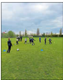
Dribbling in der Fußball Schnupperstunde

Vergangene Woche waren die Kinder der Stufe 2,3 und 4 der Ettlinger Kurse bei der SSV Ettlingen zu Gast und konnten auf dem Rasen Erfahrungen mit dem Fußball sammeln. Nach einem Aufwärmspiel und verschiedenen Torschussübungen wurde hauptsächlich gespielt.