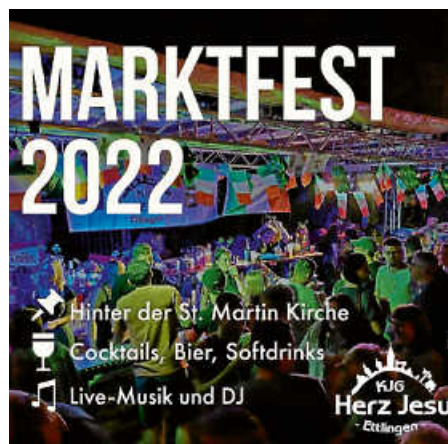
Plakat: KjG Herz-Jesu

Endlich wieder Marktfest! Tolle Stimmung, ein schönes Altstadtambiente und ein vielfältiges kulinarisches Angebot – all das ist nach der Zwangspause am Wochenende in der Ettlenger Innenstadt wieder geboten. Auch wir sind von Freitag bis Sonntag an gewohntem Standort hinter der Martinskirche anzutreffen und werden Euch mit Getränken jeglicher Art, Livemusik und guter Laune verwöhnen. Der Spaßfaktor ist an der größten Bar der Stadt also garantiert. Aber Achtung: Wegen der Baustelle an der Martinskirche erreicht Ihr uns in diesem Jahr nur über die alferne Seite.