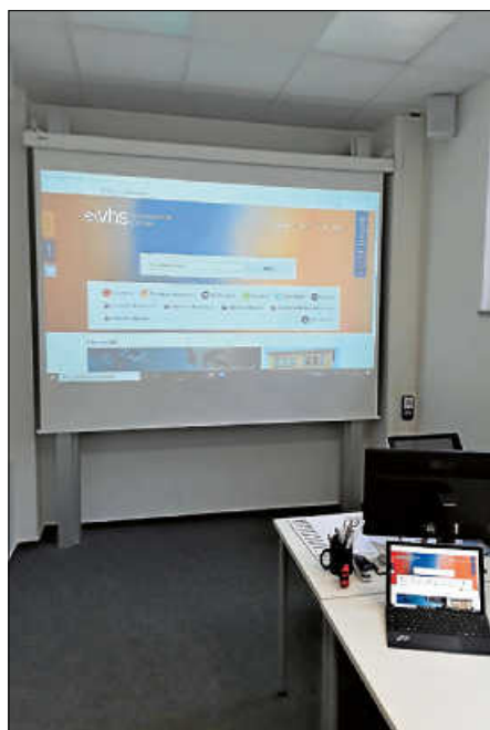
Die neue VHS-Medientechnik im Einsatz.

Die bereits im Frühjahr 2021 von der Landesregierung beschlossene ressortübergreifende Weiterbildungsoffensive ist nun auch in vollem Umfang bei den Volkshochschulen von Baden-Württemberg angekommen und umfasst unter anderem das Förderprogramm „Digitalpaket für die VHS-Bildungsarbeit“ in Höhe von 6,3 Millionen Euro bis Ende 2022.