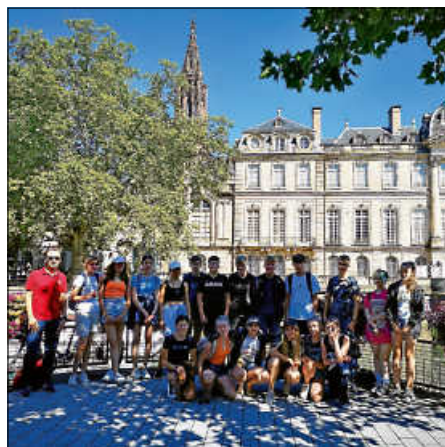
Gruppenbild am Ufer der Ill