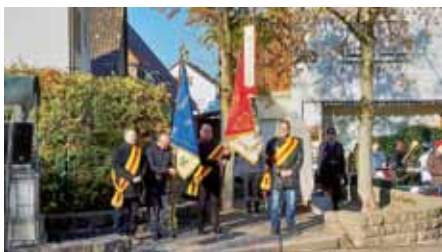
Kranzniederlegung zum Volkstrauertag 2018

Im November widmet sich die Kameradschaft ehemaliger Soldaten schon seit vielen Jahren der Pflege des ortseigenen Kriegergedenkmales am Dorfplatz und der Pflege des Gedenksteines am Waldsaumweg . Des Weiteren engagiert sich die Kameradschaft ehemaliger Soldaten bei der Haussammlung für den „Volksbund Deutsche Kriegsgräberfürsorge“ .