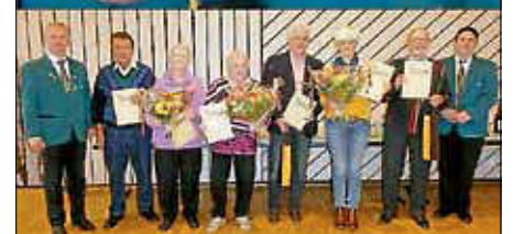
Ehrungen im November