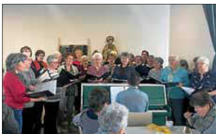
Frauenchor der Germania Spessart