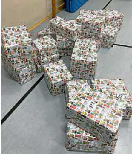
30 Pakete kamen zusammen....

Die Roten Funken wünschen schon jetzt allen Fröhliche Weihnachten und haben sich als Ziel gesetzt, die Anzahl der Pakete im nächsten Jahr nochmal zu toppen.