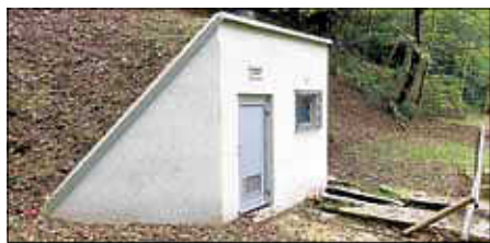
Quellhäuschen Oberweier

Die Mitglieder des Ortschaftsrates von Oberweier haben sich dafür eingesetzt, dass das Quellhäuschen am Oberweier ein ordentliches Aussehen erhält.