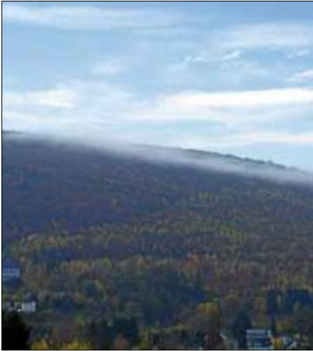
Die Hälfte der Ettliger Gemarkung ist Wald.

Bevor der Blick auf das kommende Jahr gelenkt wurde, stand das Forstwirtschaftsjahr 2015 zunächst im Fokus, das für den Wald und den Forst ein gutes war. Denn einerseits konnten die geplanten 16 000 Festmeter eingeschlagen werden dank des trockenen Herbstes. Der Holzverkauf brachte 735 054 Euro, die Erntekosten lagen bei 265 955 Euro. Andererseits läuft die natürliche Waldverjüngung in den Buchenbeständen gut weiter und es musste nicht in vollem Umfang die jungen Pflanzen gegen Wildverbiss geschützt werden bzw.