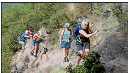
Klettersteig am Calmont

Bis vor 10.000 Jahren rauchten in der Eifel noch die Vulkane und es brodelte an vielen Stellen. Wandern wir heute in dieser Region, finden sich überall Zeugen aus dieser Zeit. Zu zehnt haben wir an drei Wandertagen diese Gegen erkundet. Die Wege führten über weite Höhen mit Blick auf erloschene Vulkane. Hinab ging es durch dichte Wälder zu steilen Schluchten mit klaren Bächen. Erfrischend (zumindest für Bronko) waren die mit Wasser gefüllte Maare, die zum Baden einladen. So manch bizarres Vulkangestein ragte in den Himmel und war zu erklimmen. Das Highlight kam am letzten Tag. Der Klettersteig am Calmont, dem steilsten Weinberg Europas stand auf dem Programm. In schwindelerregender Höhe, weit über der Mosel, führte der ausgesetzte, schmale Pfad von Bremm nach Eller, teils über Leitern an markanten Felsspornen vorbei. Stahlseile gaben Halt bei der Querung von Felsgraten. Durch die intensiven Sonnenstrahlen am Südhang lief der Schweiß in Strömen. Oder war es doch der Angstschweiß?