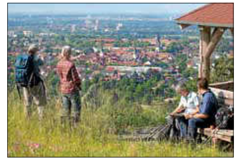
Gute Aussicht vom Kreuzelberg.

Fast 540.000 Übernachtungen bei 230.000 Ankünften verzeichnet die offizielle Statistik 2019 des Statistischen Landesamts Baden-Württemberg für das Albtal. Im Vergleich zu 2018 ein leichter Rückgang von 0,6% bei den Übernachtungen, der sich allerdings mit Blick auf die Entwicklung in Bezug zu 2017 relativiert.