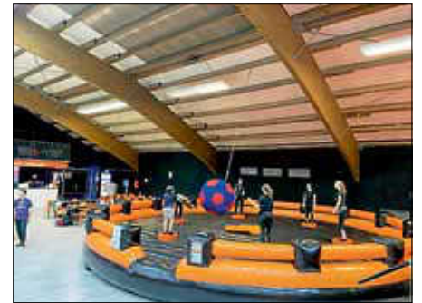
Viel Action war beim Ausflug in den Sprungpark geboten.

Wir hoffen, dass ihr alle sowie viele mehr auch in den Sommerferien mit auf unser Zeltlager (03.08. -14.08.2020) mitkommen. Anmeldungen für das Highlight des Jahres findet ihr unter www.kjg-ettlingen.de