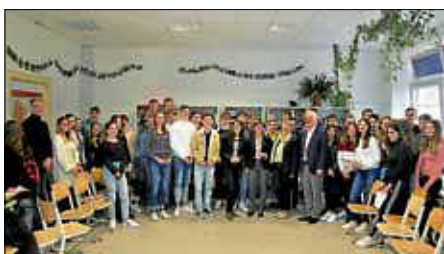
Die Abgeordneten bei der 9e und der 10e

Es war ein interessanter Vormittag und eine gute Vorbereitung des Landtagsbesuchs, den die 10e im Mai unternehmen wird.