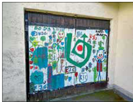
Das fertig bemalte Tor

Letzes Wochenende haben unsere neuen Gruppenleiter eine Kreativaktion veranstaltet. Schon im Voraus haben die Leiter das Tor, das unsere Leinwand werden sollte, abgeschliffen und neu gestrichen. Dann war es schon so weit, und die Kinder konnten ihrer Kreativität freien Lauf lassen. Schnell zeigten sich erste Bilder und Formen. Nachdem das ganze Tor bemalt war und kein Platz mehr frei war, wurden noch T-Shirts gebastet. Wir bedanken uns bei unseren kreativen Teilnehmern und freuen uns schon auf die nächste Aktion.