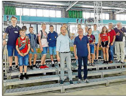
EKSA-Exkursion in die Bundesanstalt für Wasserbau.

Am 17. August waren zwölf Kinder im Alter von zehn bis vierzehn Jahren im Rahmen einer Exkursion der Ettliger Kindersommer-Akademie zu Gast in der Bundesanstalt für Wasserbau kurz BAW. Dieses Ferienprogramm richtet sich speziell an wissbegierige Schüler, die v. a. zu naturwissenschaftlichen Themen mehr erfahren wollen.