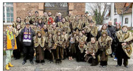
Alle aufs Treppchen