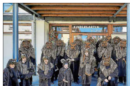
Das hat Spaß gemacht

Zusammen wurde beim Schweinetango geklatscht und geätzt. Den Kindern wurden die Masken gezeigt und sie durften Fragen stellen. Im Anschluss haben alle zusammen Faschingslieder gesungen. Die Freude war riesengroß.