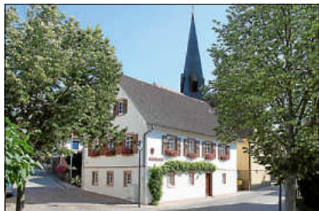
Ortsverwaltung Oberweiler