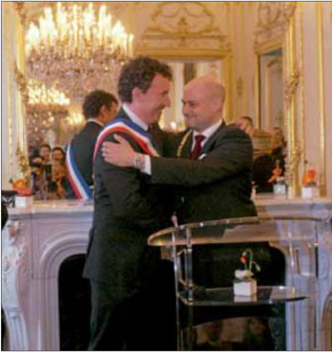
Nach ihren Reden über die leidvolle Vergangenheit und die lebendige Freundschaft zwischen Ettlingen und Epernay umarmten sich die beiden Rathauschefs, ein Bild, das sicher in die Annalen eingehen wird.