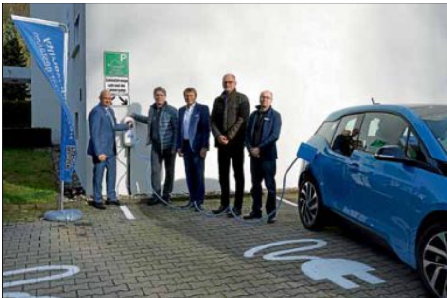
Bei der Einweihung von zwei e-Ladestationen, die in der Pforzheimer Straße bei der Ettlin AG stehen.

Seit Mittwoch vergangener Woche hat Ettlingen nun sechs öffentliche Zapfsäulen für e-Autos. Die Ettlin AG hat auf ihrem Grundstück zwei Parkplätze