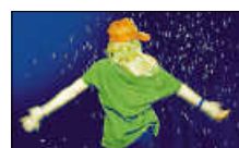
VHS - Programm 2-2021

Liebe Kursteilnehmer*innen, bitte beachten Sie, dass wegen der zuletzt pandemiebedingt ausgefallenen Weitermelde-Möglichkeiten keine „automatische“ Kursanmeldung durch die VHS erfolgen kann! Es ist für alle Angebote im neuen Semester eine telefonische Anmeldung (nur für Bestandskunden) oder Anmeldung über die Internetseite bzw. per Mail / Fax / Brief erforderlich!