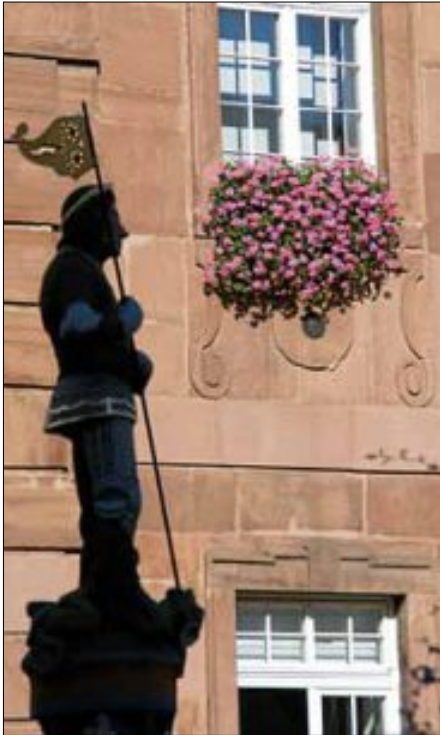
Blick über die St.-Georg-Figur des Marktbrunnens auf die Rathausfassade.