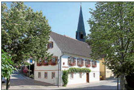
Ortsverwaltung Oberweiler

Folgende Dienstleistungen können Sie vor Ort in der Ortsverwaltung Oberweiler erledigen: