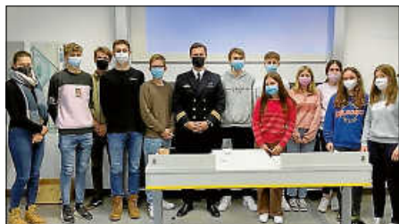
Der Politik-Kurs mit dem Jugendoffizier