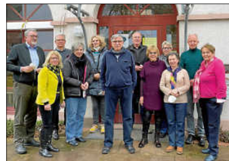
Die neuen Seniorenbeiräte der Stadt Ettlingen

Der Vorstand sowie der gesamte Seniorenbeirat der Stadt Ettlingen freuen sich, für die ältere Bevölkerung der Stadt da sein zu können.