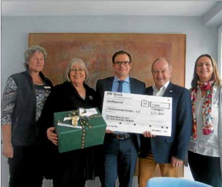
Bei der Scheckübergabe

Am Freitag, 8. Dezember, hat die Stadtwerke Ettlingen GmbH gemeinsam mit der Südwestdeutschen Stromhandels GmbH (SüdWestStrom) eine Spende von 2.000 Euro an den Förderverein Hospiz Arista übergeben.