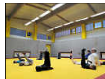
Judo in Stufe 2

Mit Stufe 2 und 3 waren wir zu Gast beim TV05 Bruchhausen und