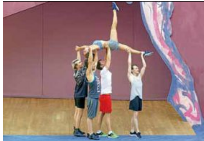
Probenfoto des Musicals „Chicago“.

soll auch ihr zu Star-Ruhm verhelfen. Die beiden Mörderinnen planen mit viel Lust und krimineller Energie ihre Karriere aus dem Gefängnis heraus.