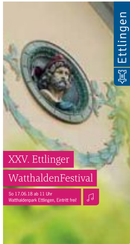
XXV. Ettlinger WalthaldenFestival So 17.06.18 ab 11 Uhr Walthaldenpark Ettlingen, Eintritt frei

Das WalthaldenFestival wird präsentiert von den Stadtwerken Ettlingen Weitere Sponsoren: Privatbrauerei Hoepfner Kulturstiftung der Sparkasse Karlsruhe Watt's Brasserie Schmid Party Service