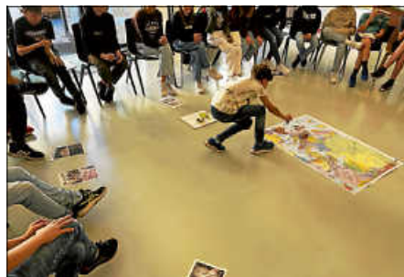
Woher kommt unser Essen?

In den nächsten Wochen wird die Klasse das Thema Ernährung wieder aufgreifen und in Form von verschiedenen selbstgewählten Projekten vertiefen.