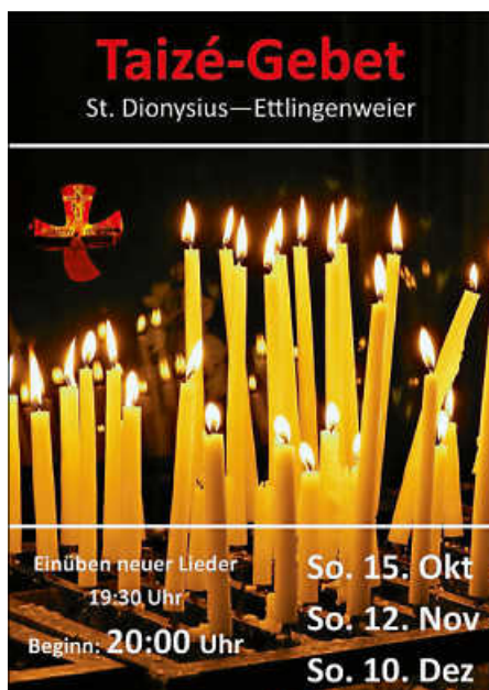
Plakat: W. Espe

Unser nächstes Taizé-Gebet findet am Sonntag, 15. Oktober, 20 Uhr statt. Die weiteren Termine bis Jahresende sind für 12.11. und 10.12. ebenfalls um 20 Uhr geplant. Wer möchte, kann gerne bereits um 19:30 Uhr kommen und mit uns die größtenteils mehrstimmigen, aber einfachen Lieder einüben.