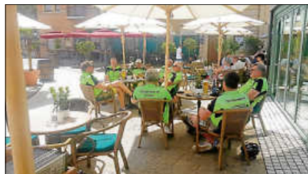
Hotel Kolosseum Rust