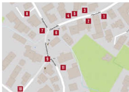
Plakat: K. D.

Start und Anmeldung Dorfmarathon (Start: Samstag 14 Uhr) 17:30 Uhr