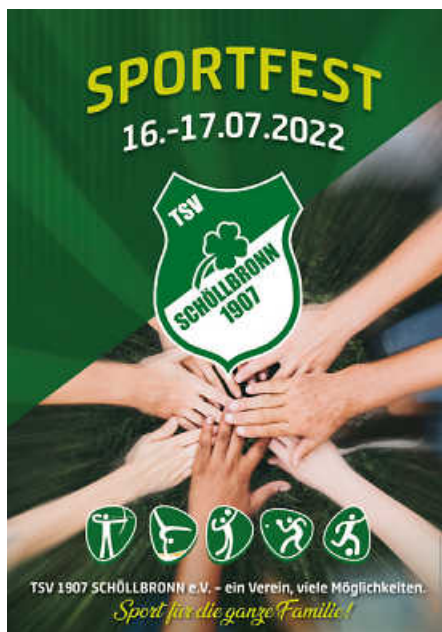
Plakat: TSV 1907 Schöllbronn e. V.

Der TSV Schöllbronn lädt alle Schöllbronner, Gäste und Freunde des Sports zu seinem diesjährigen Sportfest am 16. & 17. Juli auf das Sportgelände in der Mittelbergstraße ein.