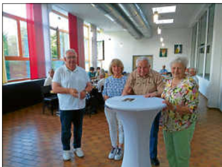
Ehrung der langjährigen Mitglieder