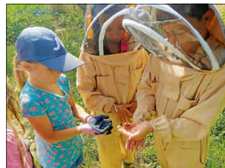
Kinder mit Drohnen