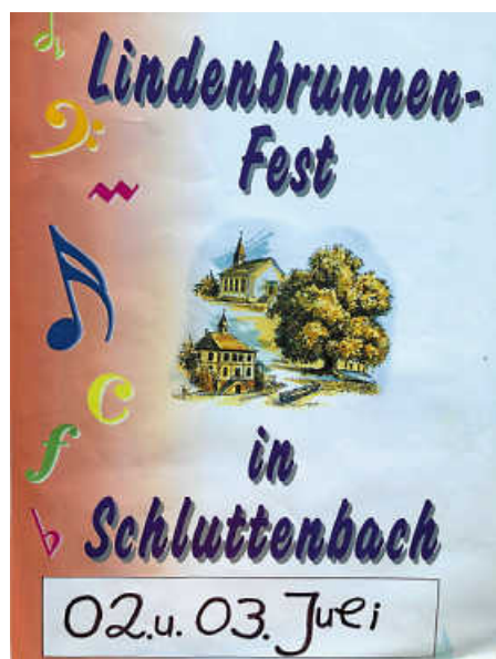
Plakat: GSV Schluttenbach

Gesangverein Sängerkranz 1889 e.V. Ettlilingen - Schluttenbach