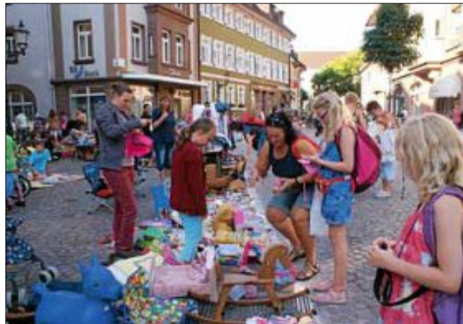
Am 25. Juli heißt es in der Innenstadt Bühne frei für die Ferienpassmäuse zum Flohmarkt, dem Auftakt zum 30-Jährigen des Ferienpasses

Sperrung der Innenstadt für den Fahrzeugverkehr