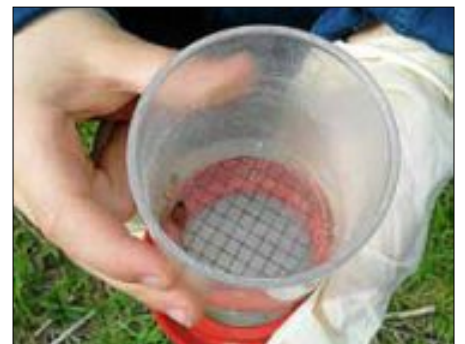
Becherlupe mit Marienkäferchen

Endlich – der Frühling ist da, die Natur blüht! Freudig gehen die Kinder des Kindergartens St. Elisabeth mit ihren Erzieherinnen auf die Wiese an ihrem wöchentlichen Naturtag. Es herrschen Frühlingsgefühle und die Gesichter der Kinder strahlen. Auf der Wiese angekommen machen sie sich mit Lupengläsern auf die Suche. Der Forscherdrang treibt die Kinder dazu, verschiedene Pflanzen und Tiere zu finden und sie in ihrem Lupenglas zu beobachten.