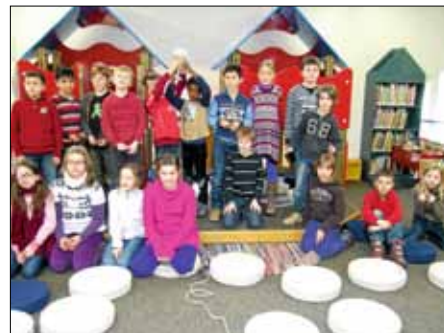
Und der "Besondere Buchtipps" kommt diese Woche von der Klasse 5a des Albertus-Magnus-Gymnasiums.

Die Jury stimmte beim Buchcasting für Riordan, Rick: Percy Jackson – Diebe im Olymp . Carlsen, 2010.