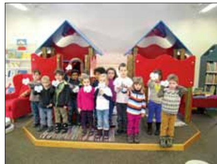
Ihr Märchenwissen testete mit großem Eifer die Klasse 3a der Schillerschule bei der Märchenrallye.

Lebhaft ging es letzte Woche mit verschiedenen Angeboten unter dem Motto „Für das Lesen begeistern“ zu. Die Geschichte vom Elefanten mit dem verborgenen Rüssel hörten und sahen Kinder des Thierkindergartens.