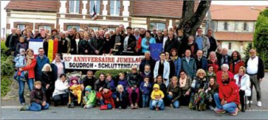
Ein an Emotionen reiches Festwochenende durften die Teilnehmer des 55-Jährigen der Städtepartnerschaft Schluttenbach-Soudron erleben.