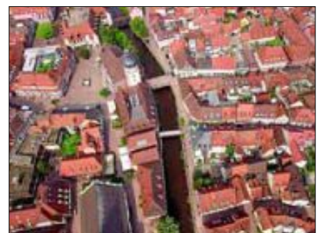
In Ettlingen wurden bereits im letzten September erste Aufnahmen gemacht.

Weitere Informationen zum Film: www.unserealb.de