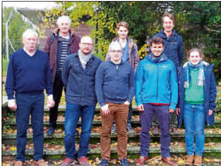
1. Mannschaft SKE (3. Rd OL Baden 14.11.21)

Mit dem Sieg sind die Chancen des SK Ettlingen auf den Klassenerhalt deutlich gestiegen. In der nächsten Runde am 05.12.2021 trifft Ettlingen auswärts auf SGR Kuppenheim, einen der direkten Konkurrenten im Kampf gegen den Abstieg.