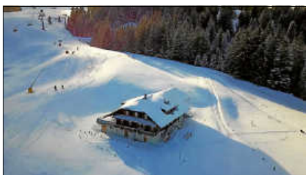
Unsere Hütte in Sörenberg

Weitere Informationen und die Anmeldung findet Ihr unter www.bergzeit-ettlingen.de .