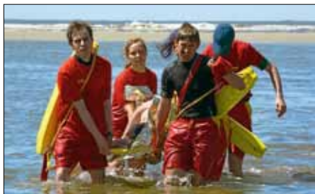
Teilnehmer während der Einsatzübung. Transport des Verunglückten aus dem Gefahrenbereich.

In der Woche vom 30. Mai bis 6. Juni stand vor allem das Erlernen und Weiterentwickeln praktischer Einsatzmethoden im Vordergrund. So wurden die Teilnehmer unter anderem auf das Retten in hoher Brandung mit allen gängigen Rettungsgeräten geschult. Wichtig dabei war es auch in der bis dahin ungewohnten Umgebung zwischen hohen Wellen und dem Lärm der Brandung zu jedem Zeitpunkt Herr der Lage zu sein. Außerdem wurde intensiv an den Fähigkeiten zur selbständigen Organisation und zur Abwicklung des Wasserrettungsdienstes und von Einsätzen gearbeitet. Der Lehrgang wurde auf Langeoog mit einer theoretischen Prüfung, sowie mit einer praktischen Einsatzübung abgeschlossen.