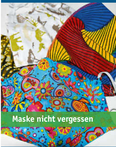
Maske nicht vergessen