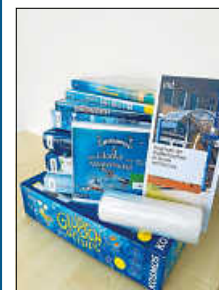
Zusätzlich bieten wir weiterhin die

Möglichkeit der Medienbestellung unter 07243/101-207 oder stadtbibliothek@ettlingen.de . Wir bereiten die Zusammenstellung dann zur kontaktlosen Abholung nach Terminvereinbarung (Di., Do. und Fr. zwischen 9 und 11.30 Uhr) oder zur Abholung während der Öffnungszeiten vor.