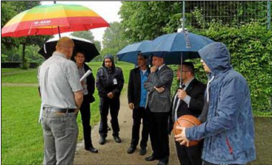
Das Aktionsteam der Stadt im Gespräch mit Jugendlichen und Anwohnern im Gatschinapark