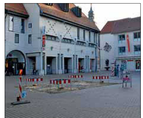
Die Platanen wurden am Montag gefällt.

Deutlich machte Heidecker, dass die Baustelle nicht ohne Beeinträchtigungen über die Bühne gehen werde. Zu der Bürgerinfo waren gut 80 Interessierte gekommen, darunter viele Einzelhändler aus dem Umfeld des Neuen Marktes aber auch darüber hinaus. Wo das Café am Neuen Markt in diesem Sommer seine Außenbestuhlung haben werde, war eine Frage. „Wir bieten dem Besitzer des Cafés den „Albstrand“ beim Rathaus an, erklärte Frau Süß. Und sollte es schlechtes Wetter geben, seien rund drei Wochen Zeitpuffer eingeplant. Weitere Fragen den Bauzeitenplan bzw. Maßnahmen betreffend, kamen nicht aus dem Plenum.