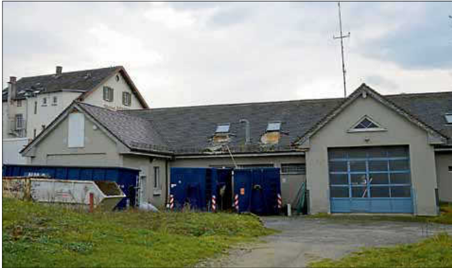
Noch steht das ehemalige Feuerwehrgebäude. Im Innern ist es bereits „ausgebeint“.