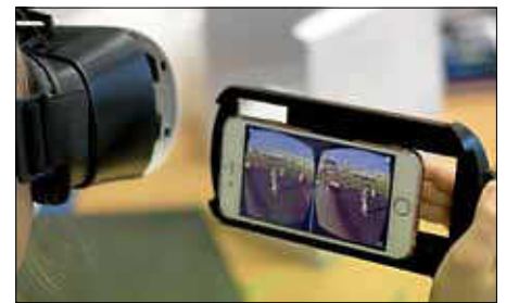
Die VR-Brille im Geschichtsunterricht

In acht Unterrichtsstunden liefen die Schülerinnen und Schüler am Ufer des Nils entlang, entdeckten die Gräber der Pharaonen in den Pyramiden oder waren Augenzeugen des ägyptischen Totenkults. Sie bereiteten Präsentationen vor und erarbeiteten sich auf diese Weise in kleinen Gruppen die faszinierende Welt einer frühen Hochkultur.